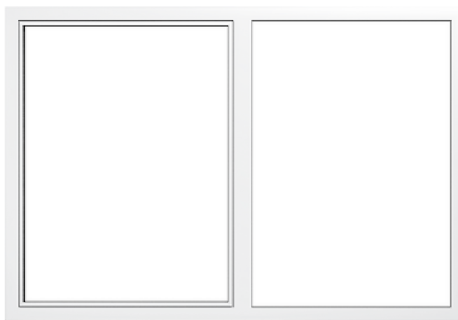
Esterno in Alluminio